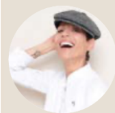
Dominique CRENN ***